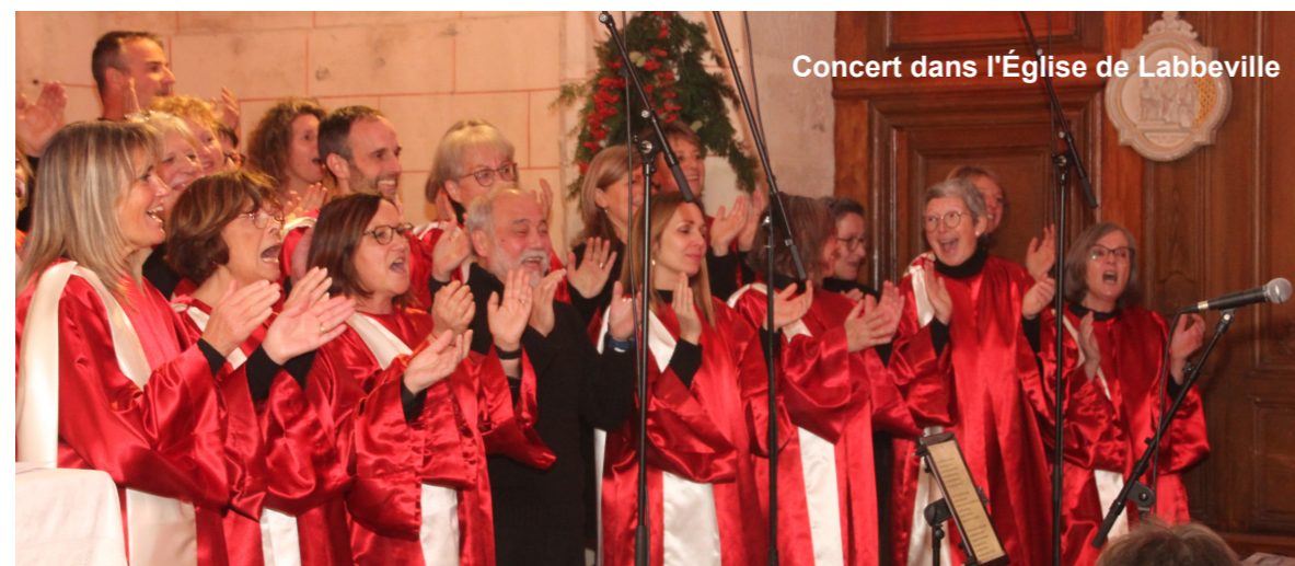
Concert dans l'Église de Labbeville