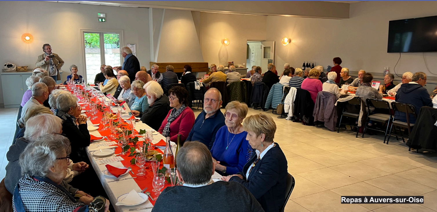
Repas à Auvers-sur-Oise