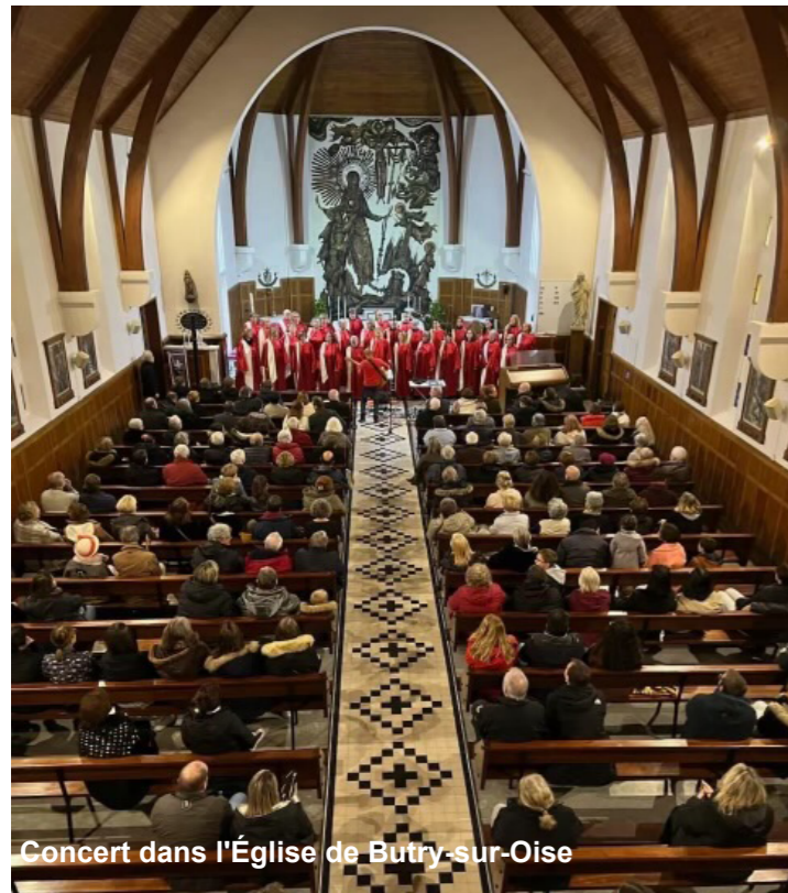
Concert dans l'Église de Butry-sur-Oise